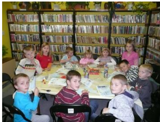
Obr. 21 o soutěže v knihovně

Obecní knihovna je otevřená 2x týdně, jinak na požádání i mimo tuto dobu. Na obnovu knižního fondu vyjde uje zastupitelstvo roční částku 18 000,- Kč ze svého rozpočtu. Významný fond máme s Místskou knihovnou v Kostelci nad Orlicí. Noc s Andersenem je již tradicí a přináší nevšední zážitky především dětem. Každý týden mají děti možnost tvoření, kterého se účastní 12 dětí. Díky prostornému stolu uprostřed dospělých oddělení je zde možné poádat besedy, adventní teny v podobě herních hodinek. Na podzim se v knihovně poádají besedy se spisovateli z klubu spisovatelů. Velice úspěšné je psaní svých příběhů Jeffíkovi, který nám odpovídá ozářtkovaným dopisem z Božího Daru.