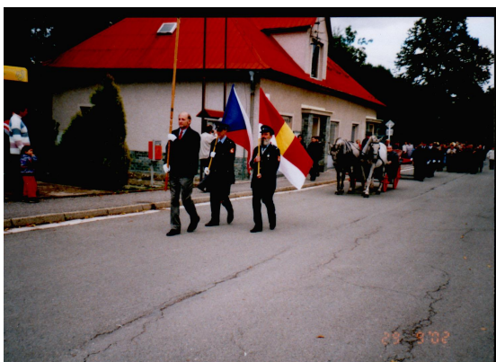
Obr. 2.6 Svěcení praporu v roce 2002