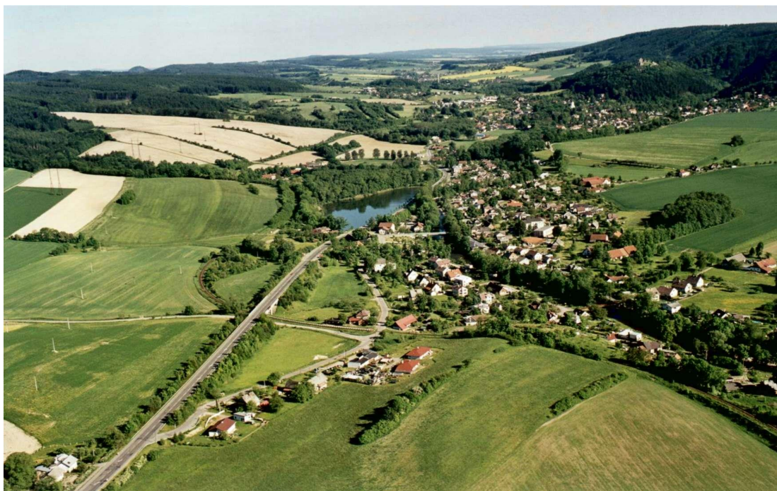
Obr. 1 ó letecký pohled Obce Zám I

Území náleží do povodí Divoké Orlice a pohybuje se v nadmořské výšce 288m (v nivě Orlice) po 430m. Je součástí Pírodního parku Orlice. Území spadá obec do působnosti města Vamberka (obec druhého stupně).